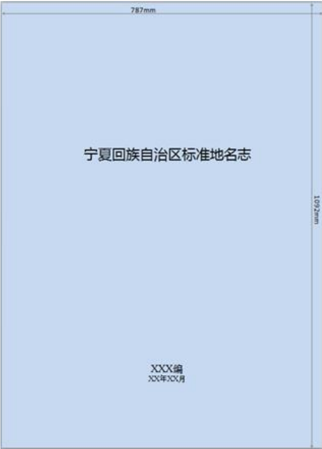
图A.3 内封尺寸及排版